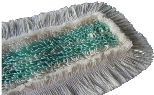
Tuftmopp Standard Hospital Grün Unterseite