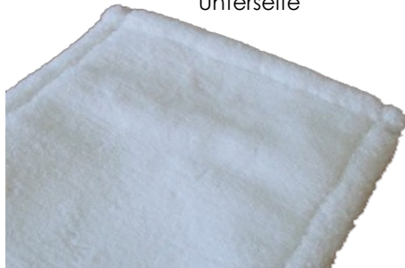
Microplüsch Basic Langflor Classic Unterseite