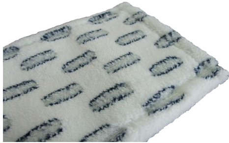
Microplüsch Standard Cluster Unterseite