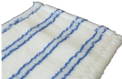
Microplüsch Royal Excellent Unterseite