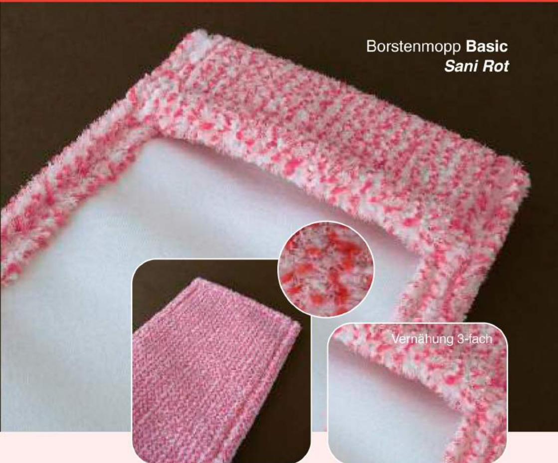
Borstenmopp Basic Sani Rot