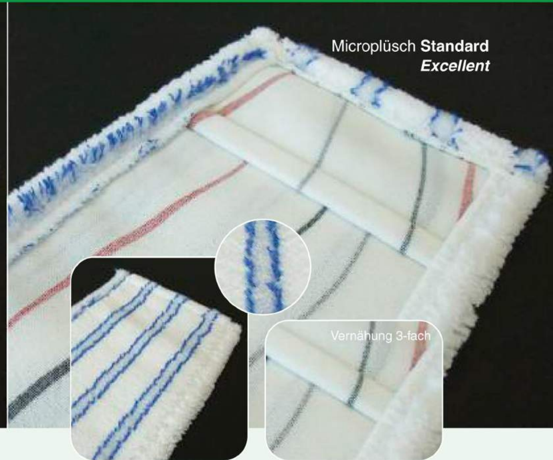
Microplüsch Standard Excellent

Der Microfaser-Mopp Excellent mit feinen Mikrokapillaren und weichen Borstenstreifen ist ein idealer Schmutzlöser mit glänzenden Ergebnissen. Insbesondere auf glatten und auch leicht rauen Bodenoberflächen ist diese Ausführung in ihrem Element. Selbst bei unterschiedlichsten Anwendungstechniken kommt der etwas höhere Flor mit sanften Borstenstreifen zu einem hervorragenden Reinigungsergebnis.