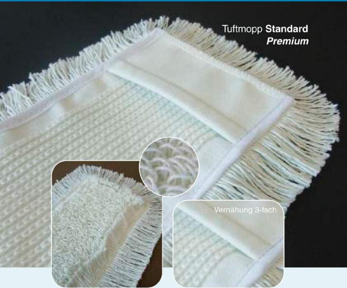
Tuftmopp Standard Premium