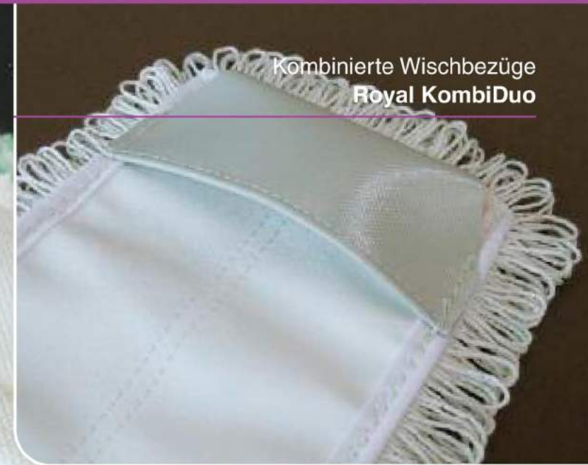
Kombinierte Wischbezüge Royal KombiDuo

KombiFlor und KombiDuo sind aus unterschiedlichen Textilgeweben und Materialien zusammengesetzt. Der KombiFlor wird aus einem sehr widerstandsfähigen Polyestergerüst gefertigt. Dabei arbeitet das spezielle Tuftingverfahren entsprechende Garnmaterialien fest in das Trägergerüst ein. Bei dem KombiFlor wird bewährtes Schlingenmaterial als Wischfläche und zugleich Wasserträger eingesetzt, umrandet von doppelt gelegten Microfaserstreifen als stabile, überstehende Randverarbeitung mit vorzüglichen Randreinigungsmöglichkeiten. Zudem löst der aktive Microfaserrand eingetrocknete Verschmutzungen und leistet damit Vorarbeit für die Schmutzaufnahme im Schlingenbereich.