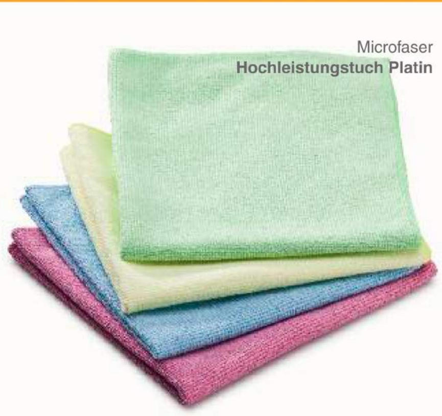
Microfaser Hochleistungstuch Platin