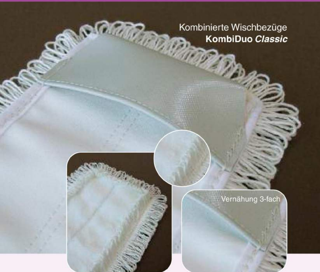
Kombinierte Wischbezüge KombiDuo Classic