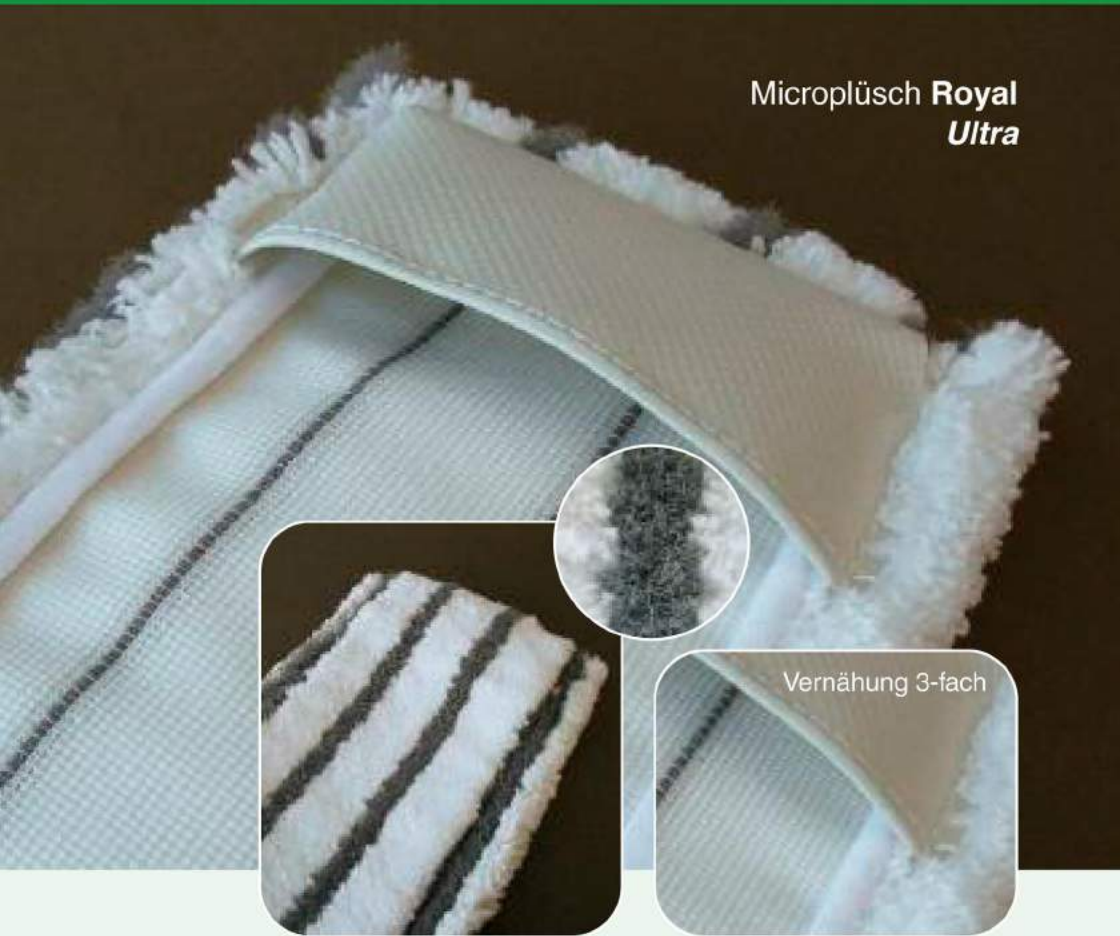
Microplüsch Royal Ultra

Unsere Kunden prüfen uns kritisch und schätzen die langjährige und zuverlässige Zusammenarbeit.