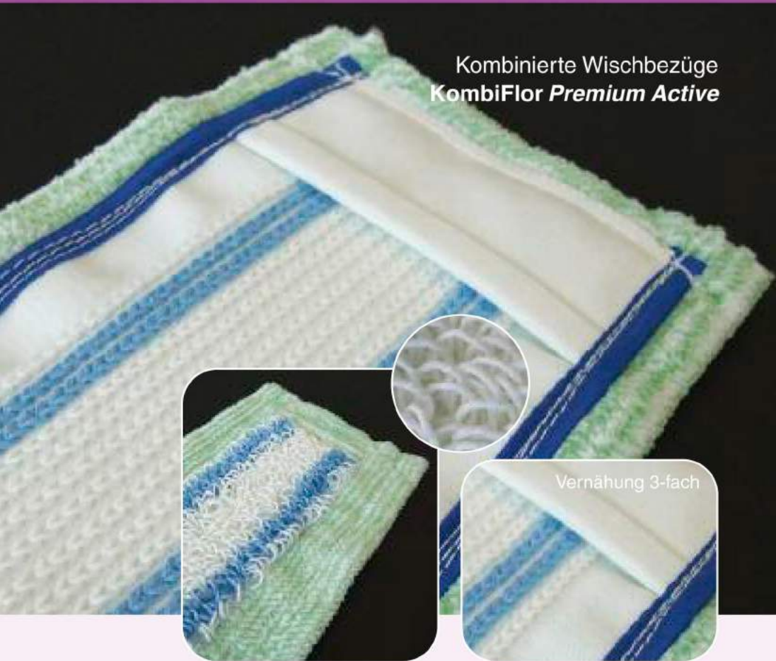
Kombinierte Wischbezüge KombiFlor Premium Active