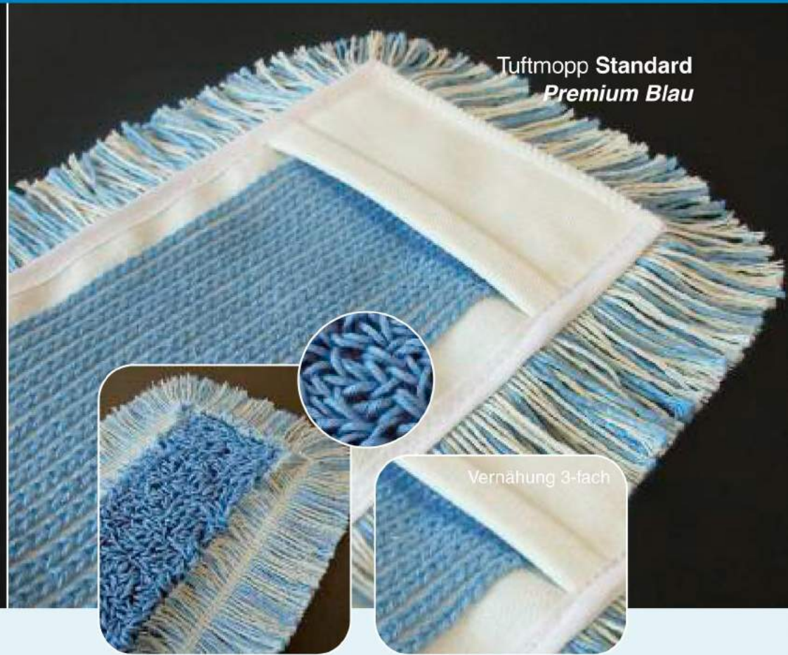
Tuftmopp Standard Premium Blau