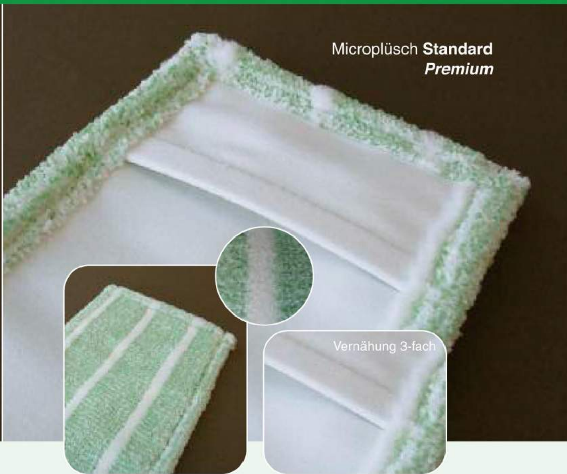
Microplüsch Standard Premium

Der Microfaser-Mopp Premium ist mit feinsten Mikrokapillaren und harten Borstenstreifen für höchste Ansprüche an Sauberkeit ausgestattet. Der sehr dichte Flor überzeugt durch schnelle Schmutzanlösung und Schmutzaufnahme. Die Ausführung Premium – ein idealer Wischbezug für Einwischtechnik. Die Kombination aus Borste und feinsten Microfaser macht den Einsatz auf fast allen Bodenbelägen möglich. Der hohe Wirkungsgrad der Faser entfernt Schmutz auch aus Microporen und kommt daher gezielt in vorwiegend hygienisch sensiblen Bereichen zum Einsatz.