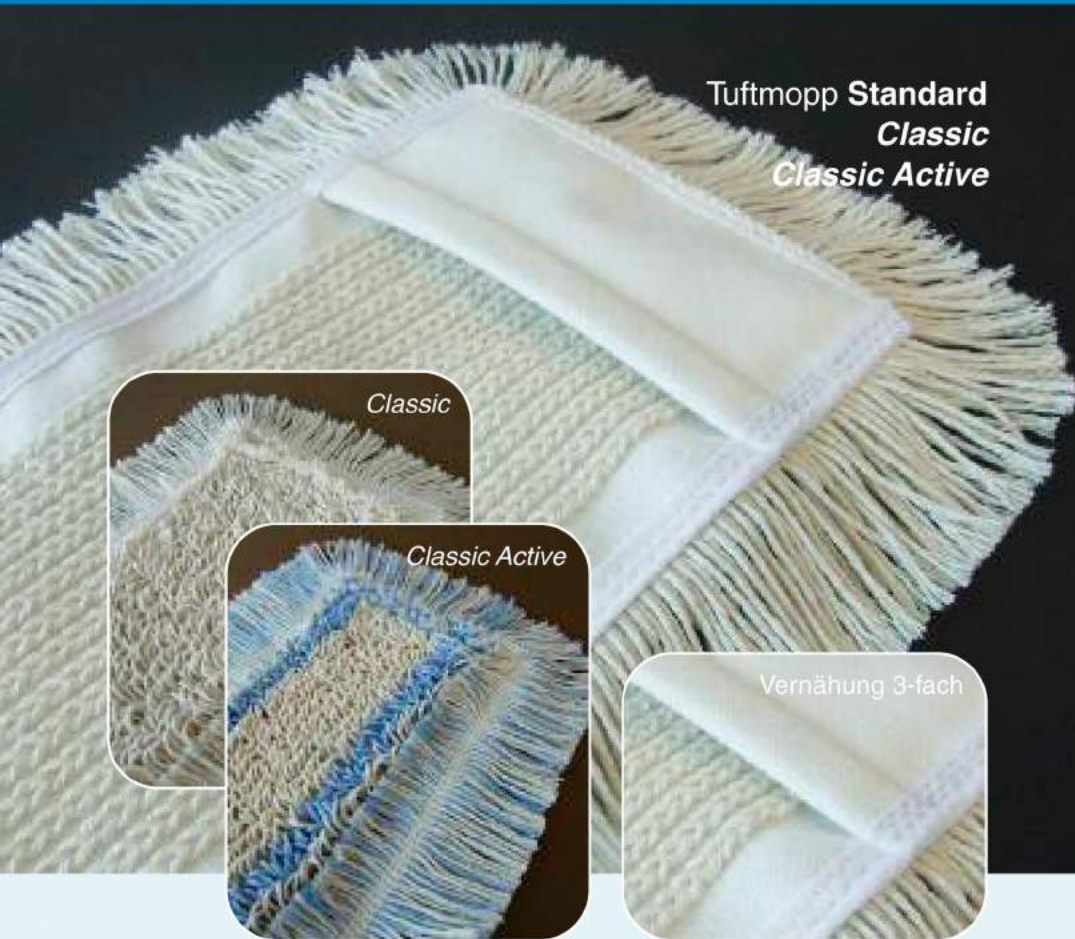
Tuftmopp Standard Classic Classic Active