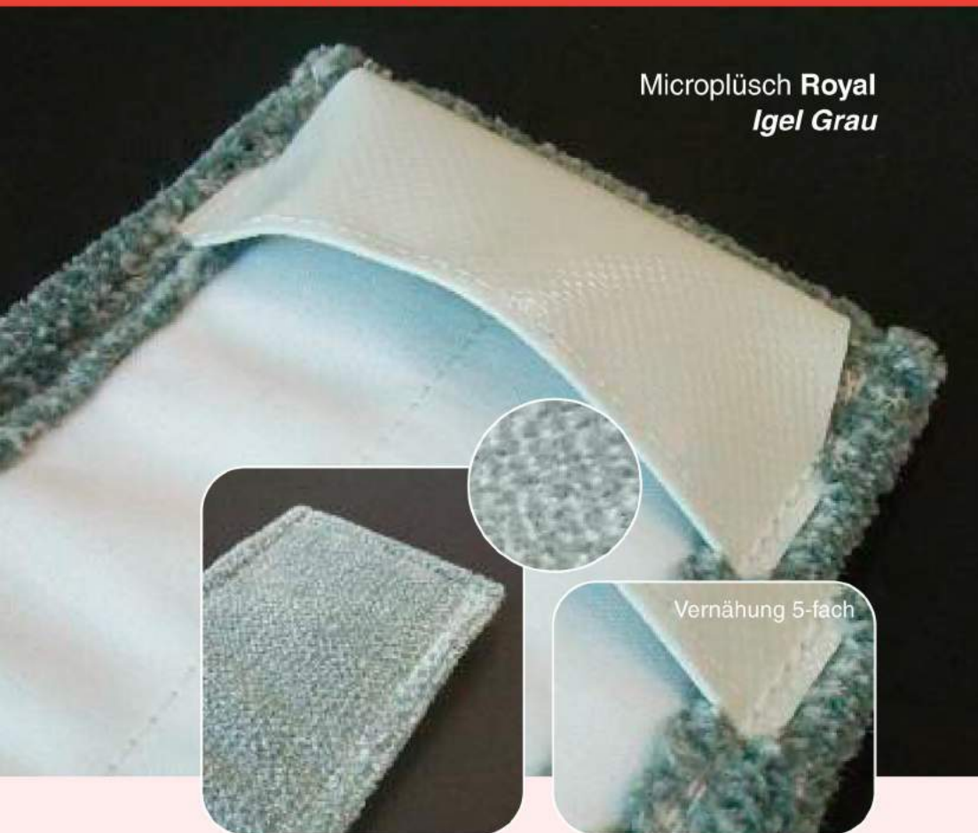
Microplüsch Royal Igel Grau