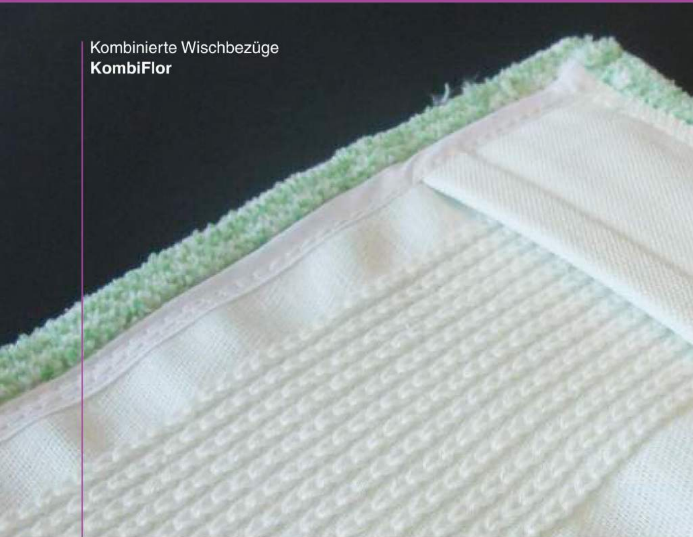
Kombinierte Wischbezüge KombiFlor