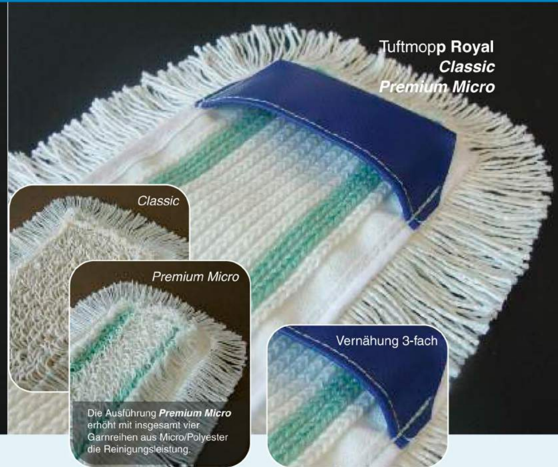
Tuftmopp Royal Classic Premium Micro

Die Grundausstattung Classic besteht aus hochwertiger Baumwolle/Polyester-Garnmischung (50/50%). Diese zeichnet sich durch gute Wasser- und Schmutzaufnahme mit hoher Flächenleistung aus. Durch die robuste Fasermischung ist die Ausführung Classic im Bereich der Unterhaltsreinigung empfehlenswert. Geliefert wird das Produkt in der Ausführung Standard-Line und Standard PVC-Line mit innen Schlinge, aussen Franse – optional auch Classic mit Aktivfaser für erhöhte Reinigungsleistung und farbigen Posamenten.