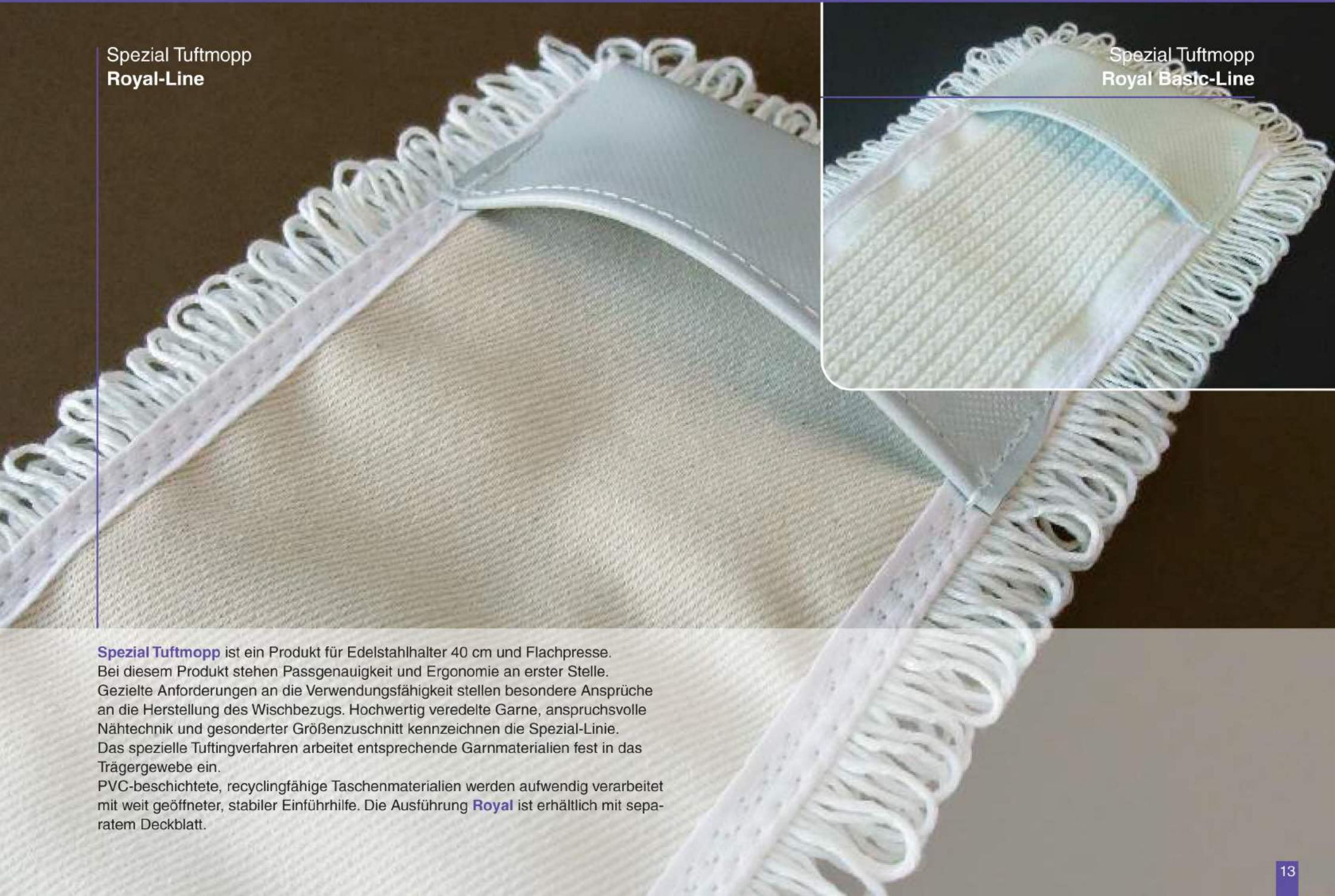
Spezial Tuftmopp Royal Basic-Line

Spezial Tuftmopp ist ein Produkt für Edelstahlhalter 40 cm und Flachpresse. Bei diesem Produkt stehen Passgenauigkeit und Ergonomie an erster Stelle. Gezielte Anforderungen an die Verwendungsfähigkeit stellen besondere Ansprüche an die Herstellung des Wischbezugs. Hochwertig veredelte Garne, anspruchsvolle Nähtechnik und gesonderter Größenzuschnitt kennzeichnen die Spezial-Linie. Das spezielle Tuftingverfahren arbeitet entsprechende Garnmaterialien fest in das Trägergewebe ein. PVC-beschichtete, recyclingfähige Taschenmaterialien werden aufwendig verarbeitet mit weit geöffneter, stabiler Einführhilfe. Die Ausführung Royal ist erhältlich mit separatem Deckblatt.