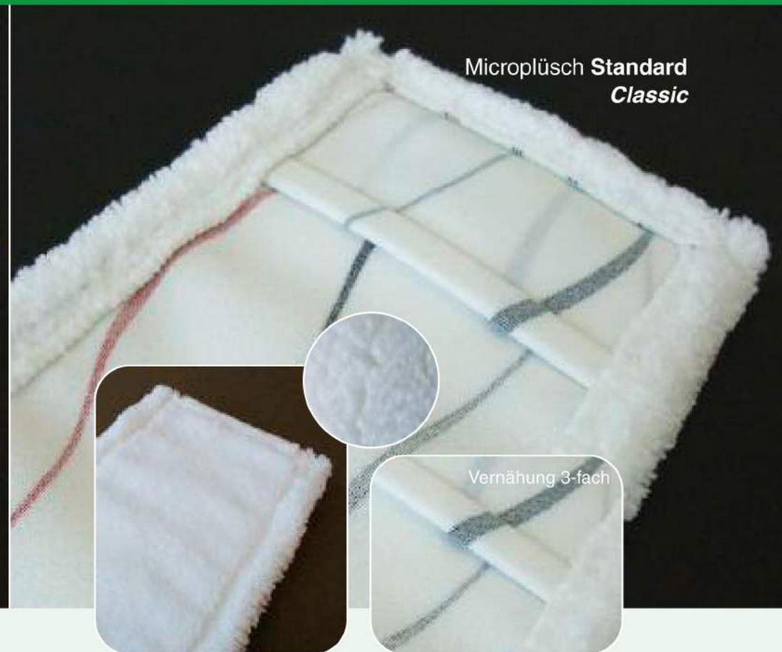
Microplüsch Standard Classic

Der Microfaser-Mopp Classic ist ein reiner Microfaser-Mopp und idealer Schmutzlöser auf allen glatten Bodenbelägen. Durch den langen Microfaserflor verfügt Microplüsch Classic über sehr gute Laufeigenschaften. Lose Verschmutzungen wie Haare, Flusen, etc. werden elektrostatisch angezogen. Daher eignet sich der Microfaser-Mopp Classic auch für die Trockenreinigung ohne Schmutz aufzuwirbeln. Der lange Microfaserflor garantiert ein perfektes Reinigungsergebnis auch auf unebenen und strukturierten Flächen. Optimale Wasseraufnahme für große Flächenleistung in der Unterhaltsreinigung.