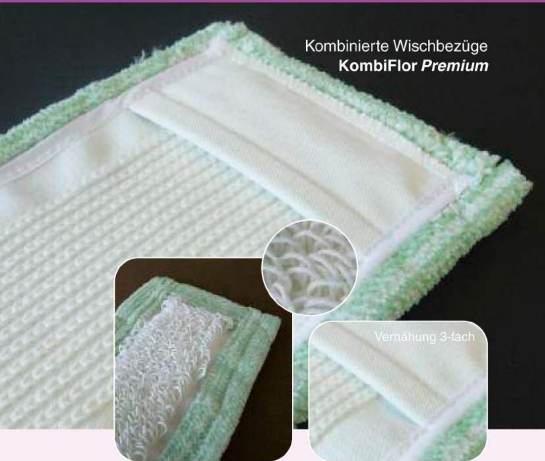
Kombinierte Wischbezüge KombiFlor Premium