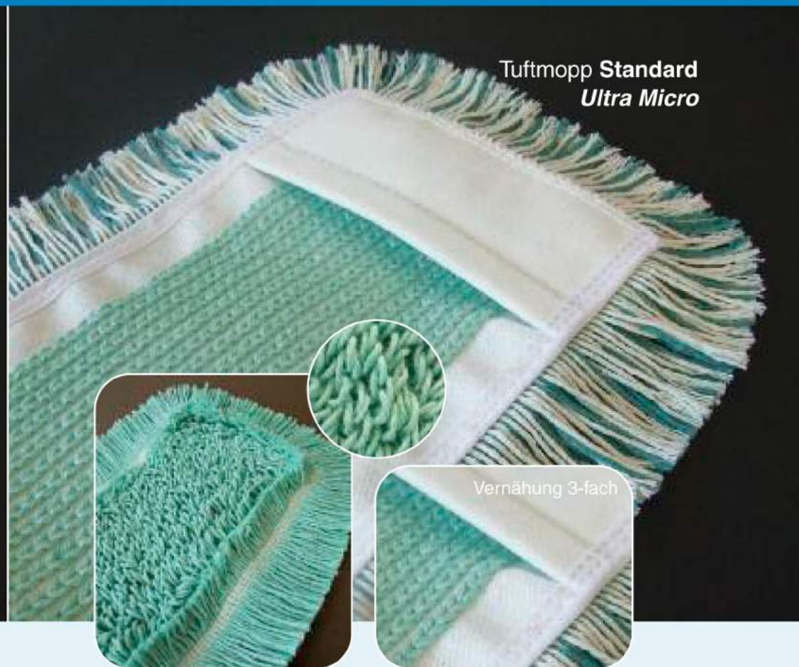
Tuftmopp Standard Ultra Micro

Ultra Micro – die aktive Microfaser garantiert hinsichtlich der Reinigungsleistung ein perfektes Reinigungsergebnis. Somit ist dieser Mopp-Bezug auch vorzüglich für „einstufiges Wischen“ geeignet. Schnelle Schmutzanlösung und -aufnahme durch feine Microfasertechnik ermöglichen porentiefe Reinigung ohne zweiten Arbeitsschritt – ein idealer Mopp-Bezug für die Aufbereitung.