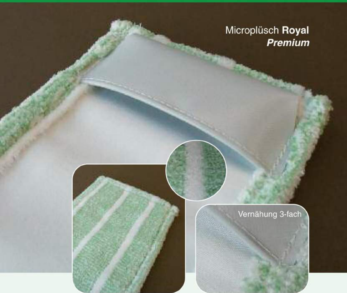
Microplüsch Royal Premium