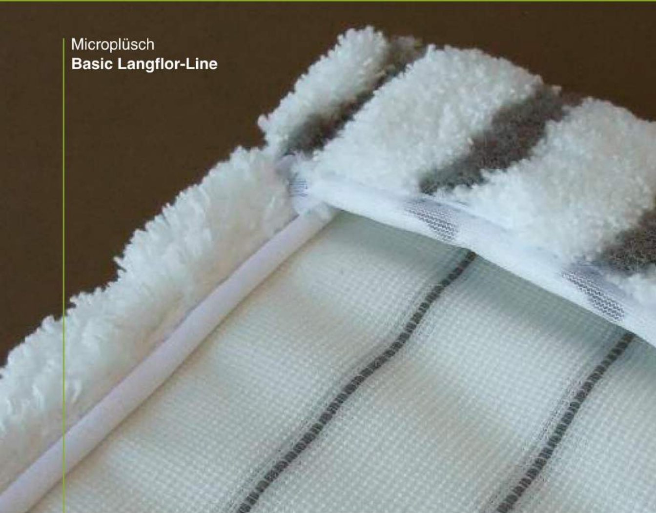
Microplüsch Basic Langflor-Line