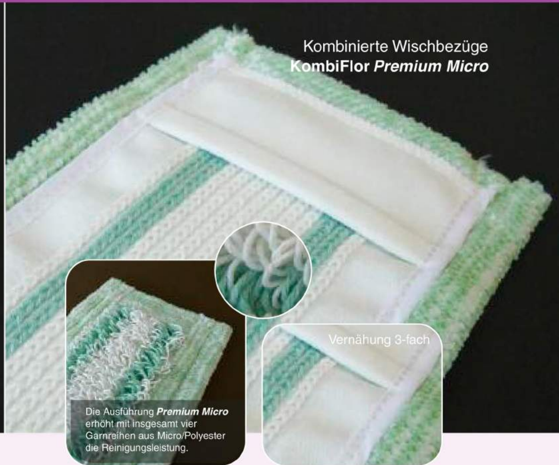
Kombinierte Wischbezüge KombiFlor Premium Micro