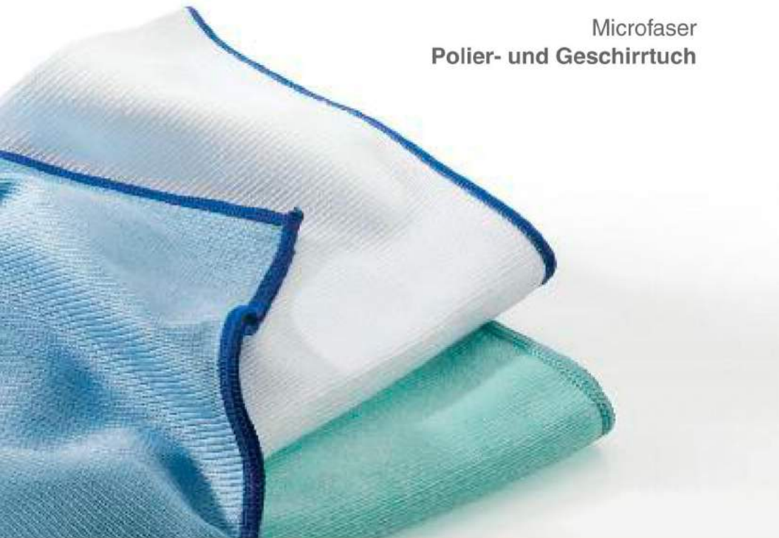
Microfaser Polier- und Geschirrtuch