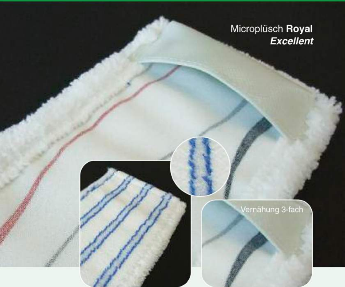
Microplüsch Royal Excellent