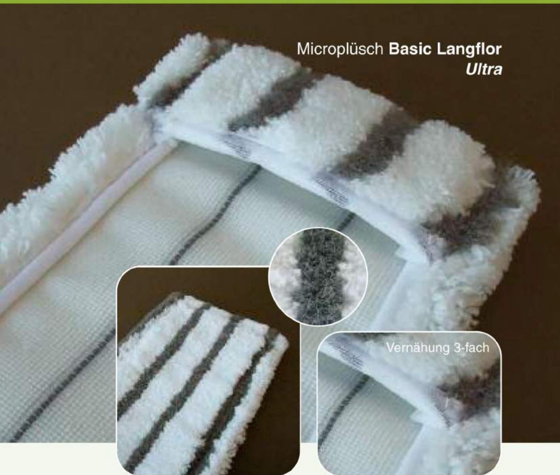
Microplüsch Basic Langflor Ultra