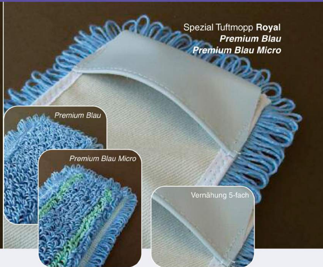
Spezial Tuftmopp Royal Premium Blau Premium Blau Micro

Die Ausführung Premium / Premium Micro besteht aus hochwertigen Viskose/ Polyester-Fasern in Ringgarn-Ausspinnung. Die aufwendige, qualitativ sehr hochwertige Ausspinnung parallelisiert die Fasern und ergibt im gewaschenen/getrockneten Zustand ein gleichmäßig und exaktes Faserbild. Nach der Veredelung überzeugt die Wischfläche durch hervorragende Schmutzaufnahme und optimale Gleiteigenschaften. Garnmischungen mit entsprechend qualitativen Merkmalen speichern Flüssigkeiten in den Kapillaren ab, verhindern damit eine ungewollt schnelle Flüssigkeitsabgabe und ermöglichen so eine gleichmäßige Benetzung. Die in diesem Wischtextil verwendeten Fasermischungen entsprechen den allgemeinen Empfehlungen der RKI-Richtlinien und erfüllen daher besonders in Krankenhäusern und in hygienisch sensiblen Bereichen die hohen Ansprüche der Reinigungsstandards. Die Ausführung Premium Micro steigert die Reinigungsleistung mit insgesamt 4 Garnreihen aus Microfaser/Polyester. Die Ausführung Royal-Line ist mit Deckblatt erhältlich.