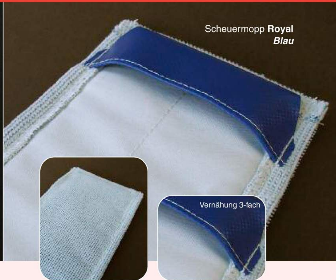
Scheuermopp Royal Blau