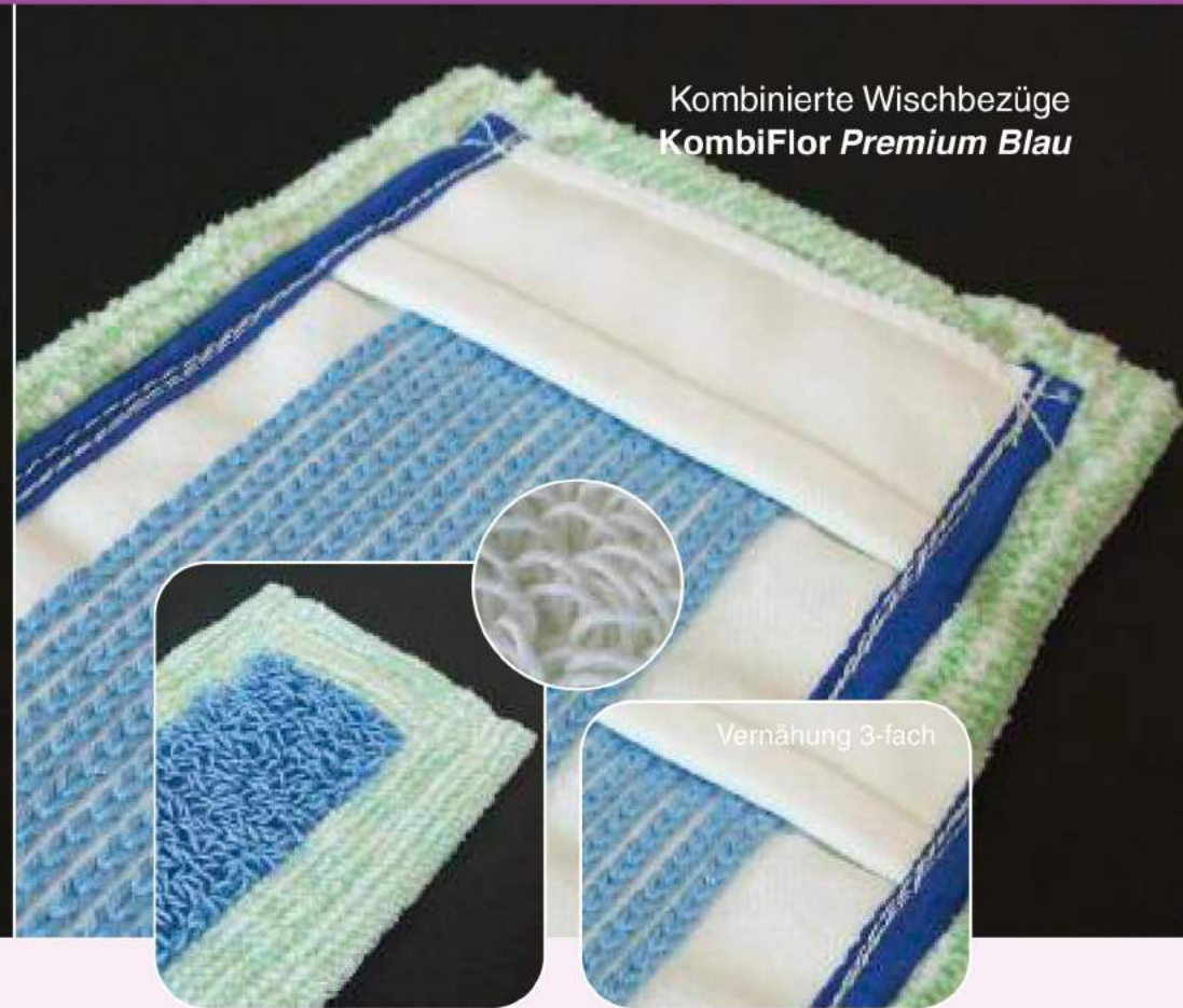
Kombinierte Wischbezüge KombiFlor Premium Blau