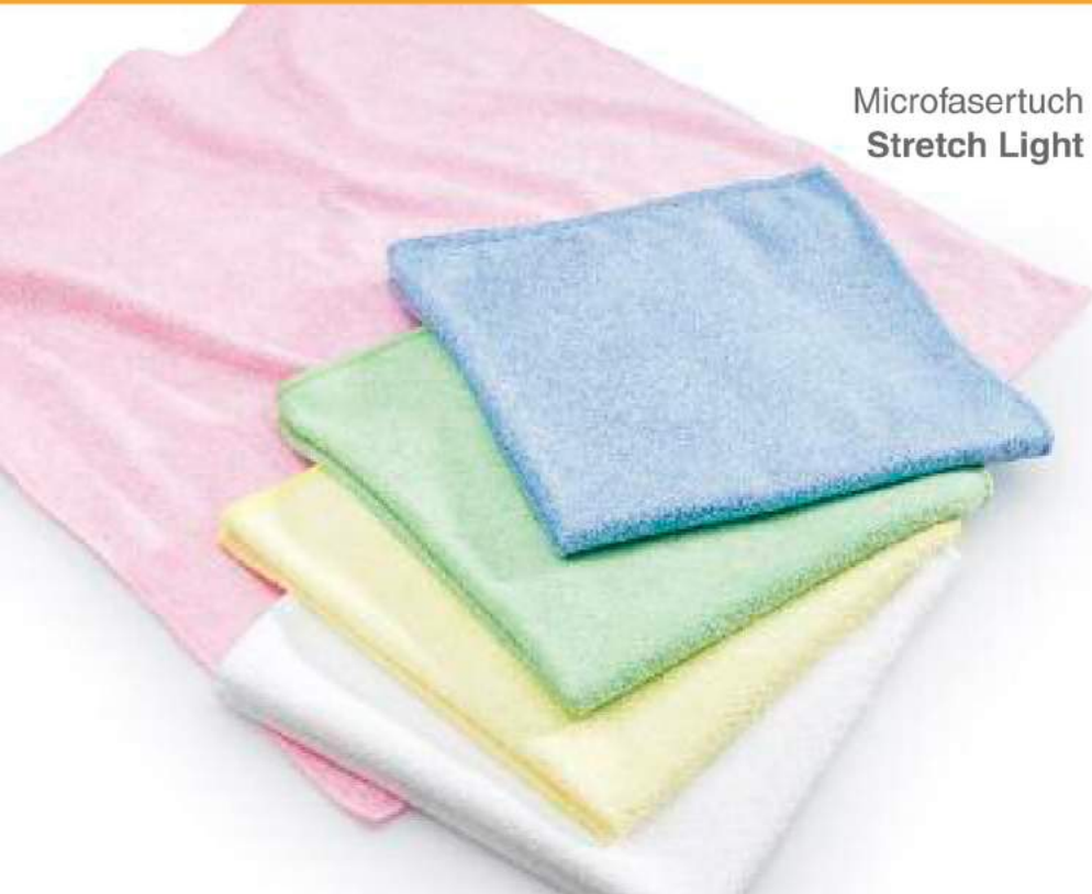
Microfasertuch Stretch Light