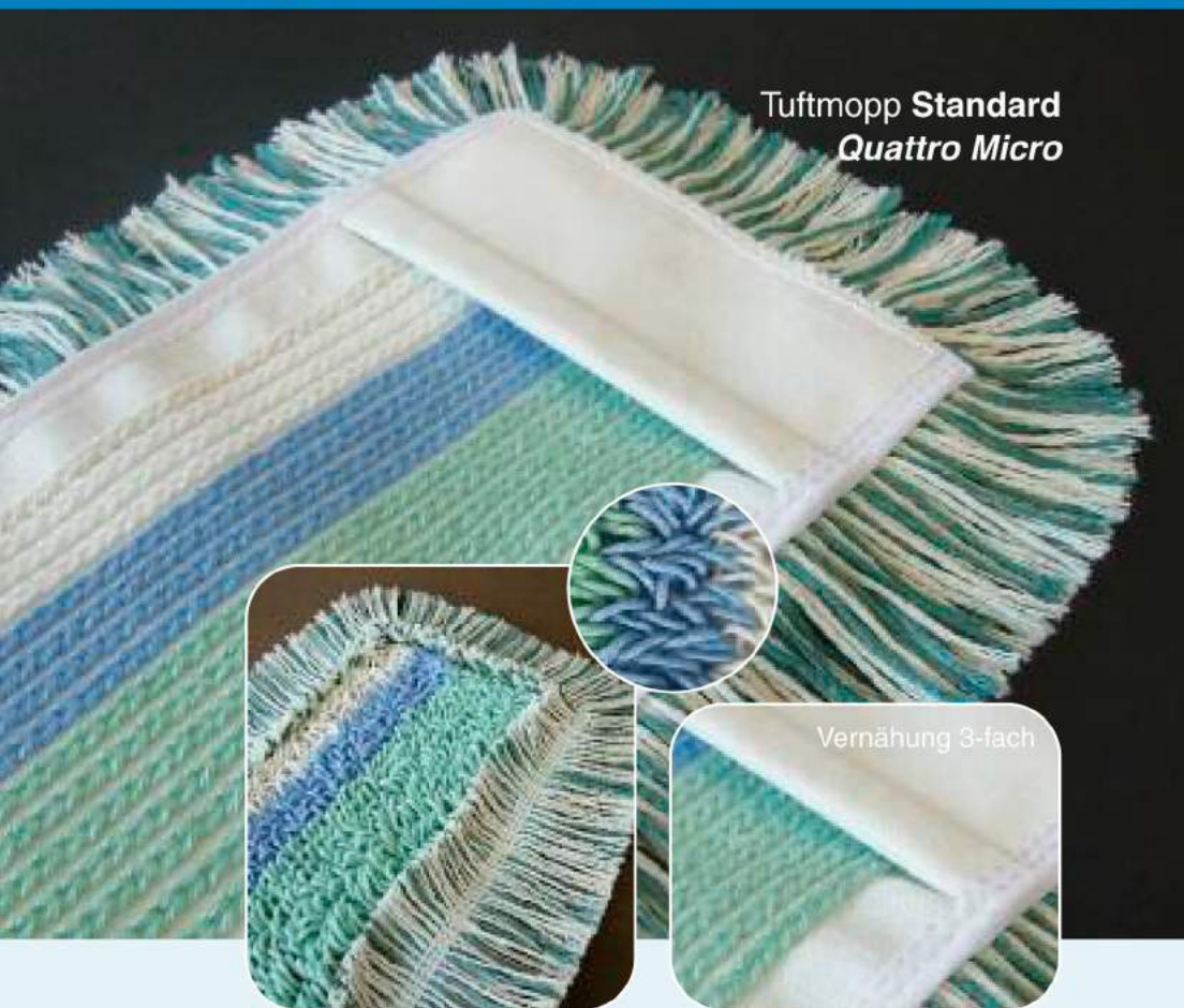
Tuftmopp Standard Quattro Micro