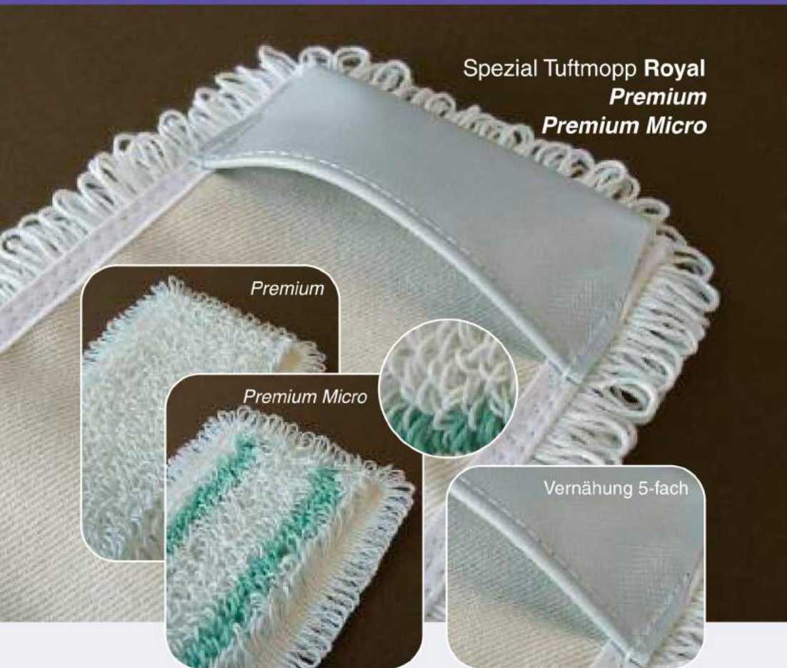
Spezial Tuftmopp Royal Premium Premium Micro